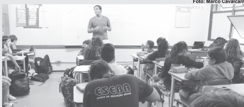
São oferecidas 30 vagas para ampla concorrência

São oferecidas 60 vagas para o 1º período da Educação Infantil, assim distribuídas: 8 vagas para perfil socioeconômico (M1 - PSE), para candidatos(as) com renda familiar bruta per capita igual ou inferior a 1,5 salário mínimo; 8 vagas para pretos, pardos e indígenas (M2 - PPI/PSE), para candidatos(as) declarados(as) pretos, pardos ou indígenas, por seu pai, mãe e/ou responsável, com renda familiar bruta per capita igual ou inferior a 1,5 salário mínimo; 8 vagas para pretos, pardos e indígenas (M3 - PPI), para candidatos(as) declarados(as) pretos, pardos ou indígenas por seu pai, mãe e/ou responsável, independente da renda bruta familiar; 2 vagas para